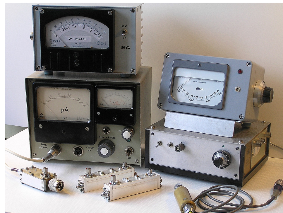
W-metr do 500MHz , pod ním šumový generátor se sondou, UHF směrové členy pro měření na anténách, měřič úrovně vf.do 500 MHz a rozmítač VHF.