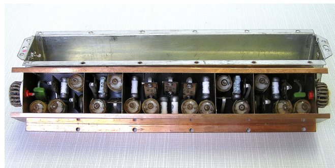
Odkrytovaný příčkový x-tal. filtr, používaný v konstrukcích OK2JI