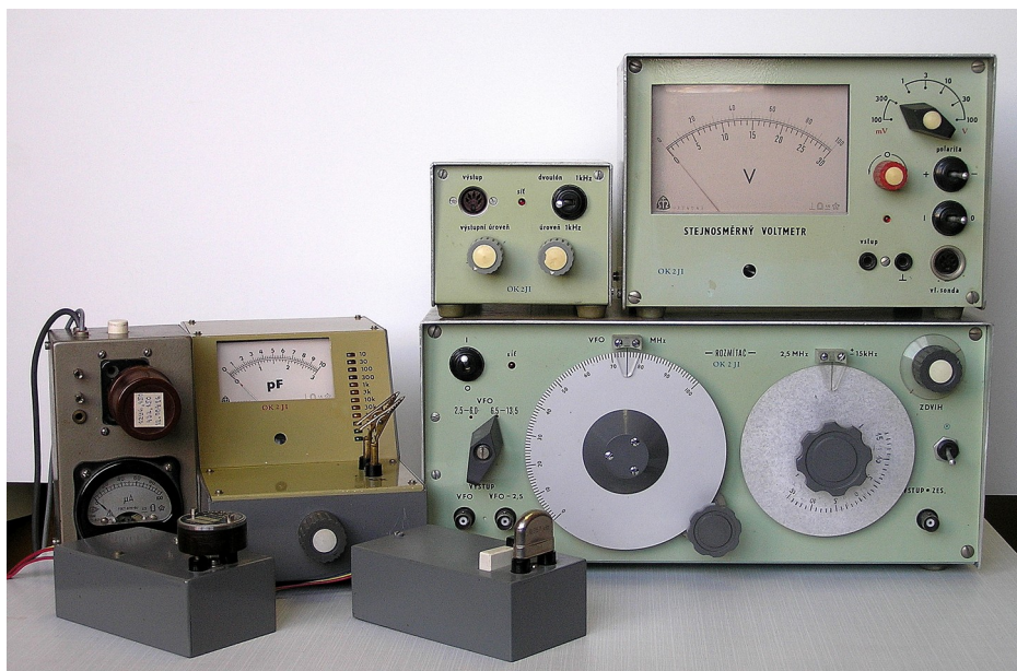
Měřicí přípravky pro úpravu x-talů, měřič kapacit, dvoutónový generátor, elektronkový voltmetr a rozmítač pro nastavování x-talových filtrů. Na snímku dole, křivka čtyř x-talového filtru, sejmutá rozmítačem.