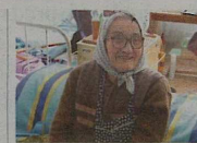
Dôchodky Hodnota majetku sporiteľov v druhom pilieri sa mierne zvýšila.

■ Dôchodkové správcovské spoločnosti evidovali ku koncu predminulého týždňa vo svojich fondoch majetok sporiteľov vo výške 54,631 mld. Sk. Čistá hodnota majetku sporiteľov v druhom dôchodkovom pilieri sa tak počas predminulého týždňa zvýšila o 349,3 mil. Sk. V rastových fondoch evidovali dôchodkové spoločnosti k mi-