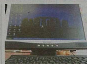
Nelagálny softvér Pirátsvo oberá výrobcov originálnych programov o miliardy.