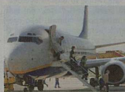
Lietanie Väčšina ľudí lietadlom ešte necestovala, hovorí prieskum.

■ Takmer tri štvrtiny ľudí na Slovensku ešte nikdy necestovali lietadlom. V blízkej budúcnosti však asi desatina z nich plánuje služby leteckej dopravy využiť. Vyplyva to z prieskumu spoločnosti GfK Slovakia. Prieskum tiež ukázal, že väčšina slovenských cestujúcich uprednostňuje naše letiská pred letiskami susedných štátov. Za posledné tri roky využilo služby bratislavského letiska vyše 60 percent respondentov, ktorí už lietadlom cestovali.