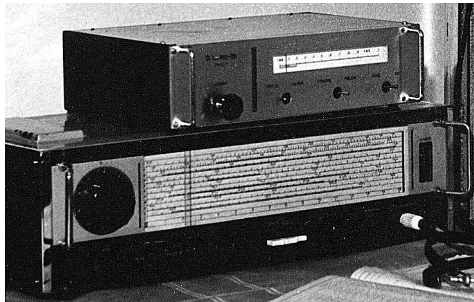
Na Rxu celotranzistorový TX -FM – 5W (1967)