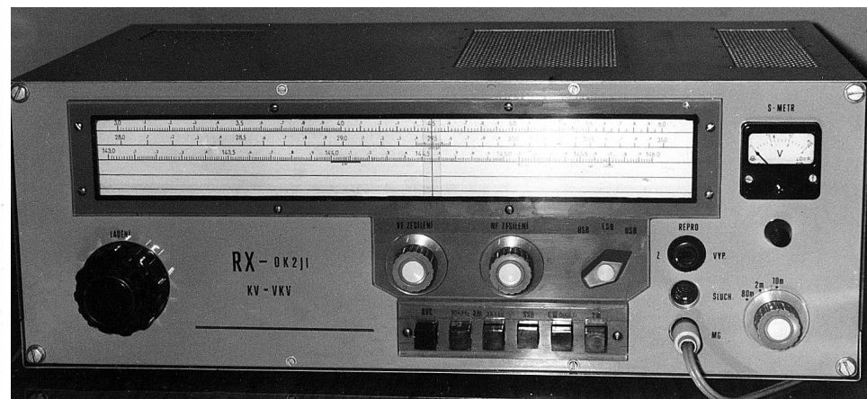
RX 28 a 144MHz pro provoz přes kosmický převaděč „ OSCAR-6“