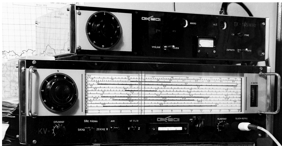
Celotranz. RX na KV, 144 a 432Mhz, nahoře hybridní TX pro 144MHz. PA osazen 2x elektronkami E180F s měničem 12/150V. (Rok 1967)