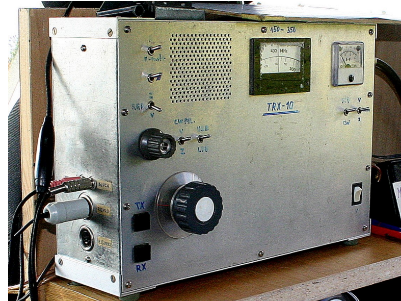
TRX-10 432 MHz /20W pro napájení z baterie 13V