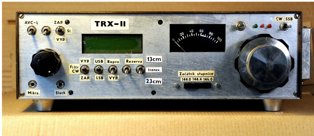
TRX-11 Zařízení pro 144Mhz a transvertory 1296/2300Mhz out. 100mW V zařízení použit Xtalový 14ti násobný příčkový filtr. (patrný na snímku vpravo)