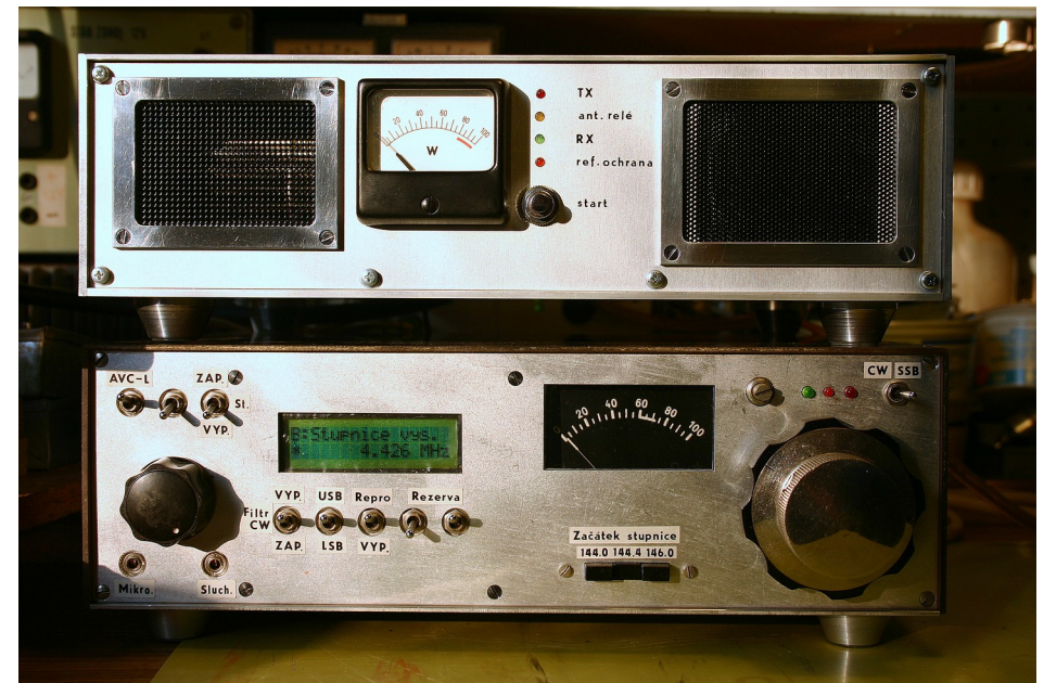
TRX-11 ve spojení s výkonovým stupněm 70W Zařízení bylo použito v mnoha závodech ze stálého i /p QTH